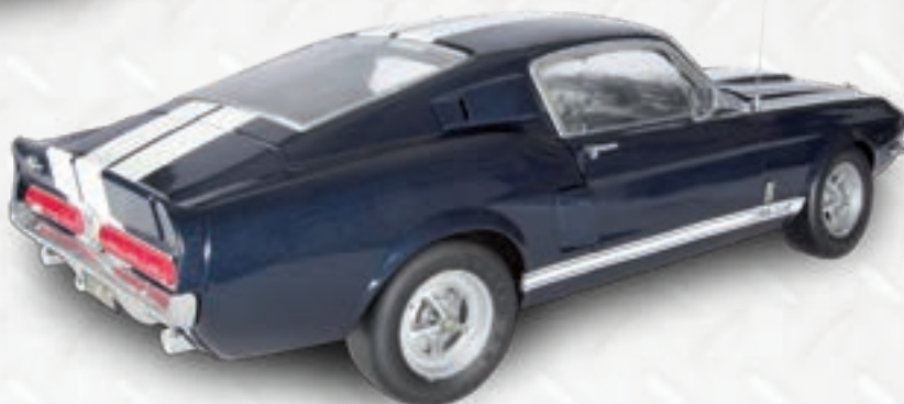
Заднее правое крыло