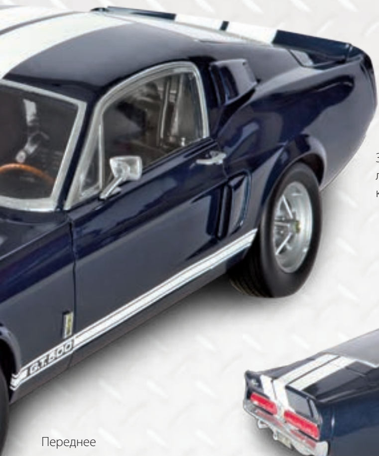
Заднее левое крыло