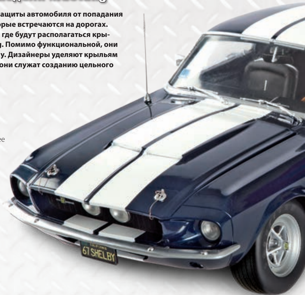
Переднее правое крыло

Крылья предназначены для защиты автомобиля от попадания внутрь мусора и камней, которые встречаются на дорогах. На этом фото можно увидеть, где будут располагаться крылья на вашей модели Mustang. Помимо функциональной, они несут и эстетическую нагрузку. Дизайнеры уделяют крыльям особое внимание, поскольку они служат созданию цельного образа автомобиля.