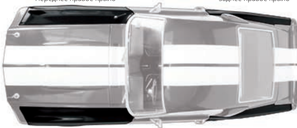
Переднее правое крыло